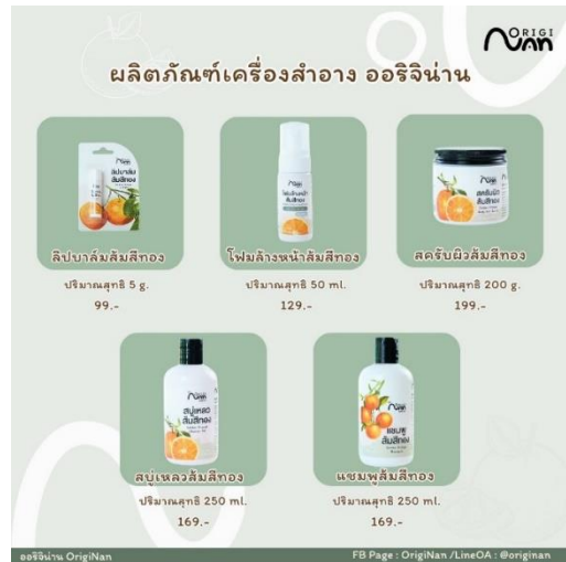
ร้านค้าที่ ๗ Young Smart Famer จังหวัดน่าน สวนสวรรค์ ตำบลสะเนี่ยน อำเภอเมืองน่าน จำหน่าย กล้วยไม้ ผลไม้ตามฤดูกาล และผลิตภัณฑ์แปรรูปทางการเกษตร