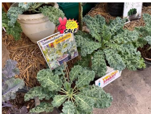
ร้านค้าที่ ๑๐ Young Smart Famer จังหวัดน่าน สวนผักฮักน่าน ตำบลไชยสถาน อำเภอเมืองน่าน จำหน่ายผักไฮโดรโปนิกส์