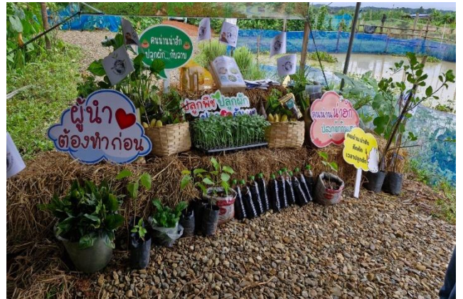
๑. มีการจัดตลาดแลกเปลี่ยน “แบ่งปัน ปันเธอ” ส่งเสริมให้บุคลากรในสังกัดและเครือข่าย แบ่งปัน จำหน่ายและแลกเปลี่ยนผลผลิต ภายในและนอกองค์กร