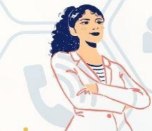
ผอ.สำนักพัฒนาทุนฯ