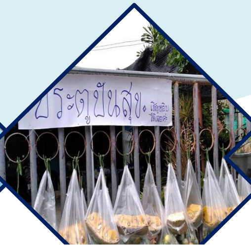
สร้างความมั่งคั่ง