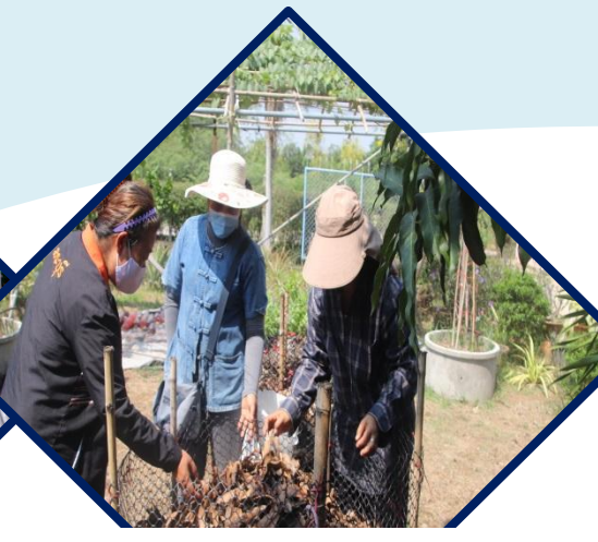
สร้างความยั่งยืน