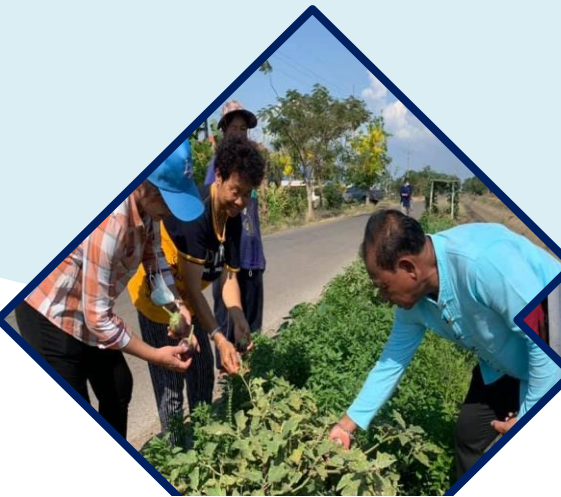
สร้างความมั่นคง

กิจกรรมย่อยที่ ๘.๒ จัดเวทีแลกเปลี่ยนบทเรียนความสำเร็จผู้นำการเปลี่ยนแปลง (ระดับอำเภอ)