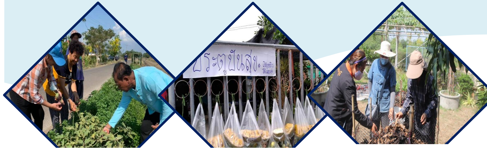
สร้างความมั่นคง

กิจกรรมย่อยที่ ๘.๒ จัดเวทีแลกเปลี่ยนบทเรียนความสำเร็จผู้นำการเปลี่ยนแปลง (ระดับอำเภอ)