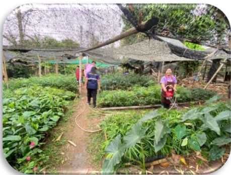
สร้างความมั่นคง

กิจกรรมที่ ๘ สร้างพลังเครือข่ายและขยายผลผู้นำการเปลี่ยนแปลง กิจกรรมย่อยที่ ๘.๒ จัดเวทีแลกเปลี่ยนบทเรียนความสำเร็จผู้นำการเปลี่ยนแปลง (ระดับอำเภอ)