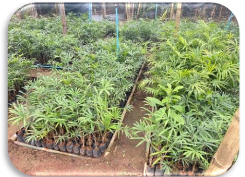
สร้างความยั่งยืน