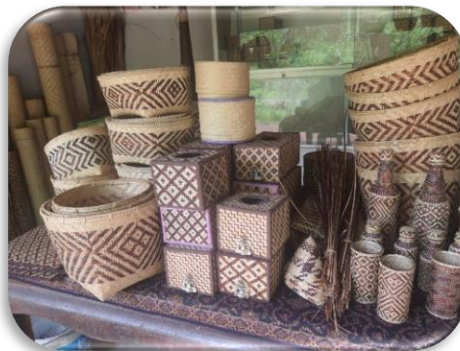
สร้างความมั่งคั่ง