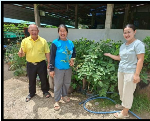
สร้างความมั่นคง

กิจกรรมย่อยที่ 8.2 จัดเวทีแลกเปลี่ยนบทเรียนความสำเร็จผู้นำการเปลี่ยนแปลง (ระดับอำเภอ)