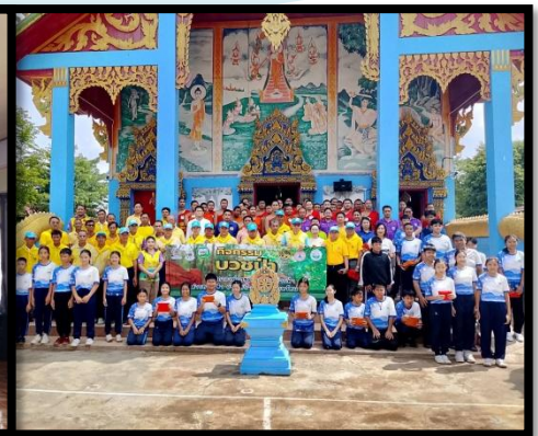
สร้างความยั่งยืน