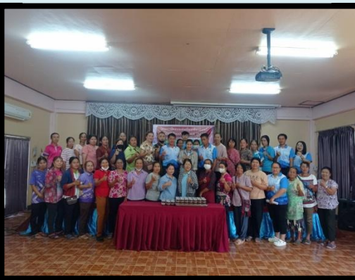
สร้างความมั่งคั่ง