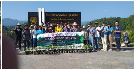
กิจกรรมปลูกต้นไม้ปลูกหญ้าแฝก