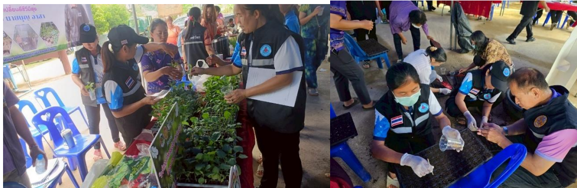
๕) รมรณรงค์สร้างเสริมความปลอดภัยของอาหาร เช่น อาหารปลอดภัย/สารปนเปื้อน การไม่กินอาหารสุก ๆ ดิบ ๆ