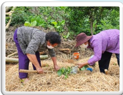
สร้างความมั่นคง

โครงการเสริมสร้างและพัฒนาผู้นำการเปลี่ยนแปลง กิจกรรมที่ ๘ สร้างพลังเครือข่ายและขยายผลผู้นำการเปลี่ยนแปลง กิจกรรมย่อยที่ ๘.๒ จัดเวทีแลกเปลี่ยนบทเรียนความสำเร็จ ผู้นำการเปลี่ยนแปลง (ระดับอำเภอ)