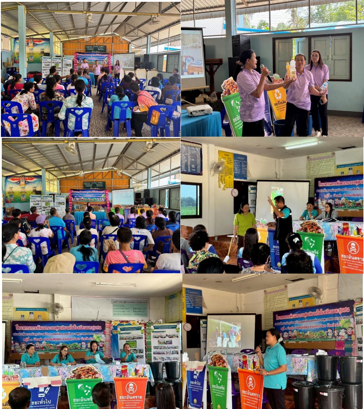
ภาพกิจกรรม การบูรณาการ “แยก ก่อนทิ้ง ลดขยะ ลดมลพิษ”