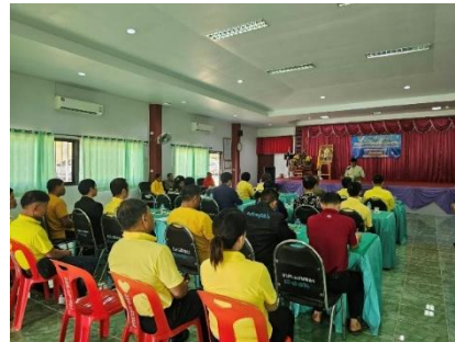
บันทึกข้อตกลงความร่วมมือตำบลเข้มแข็ง