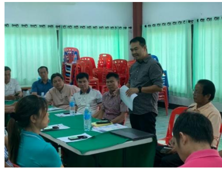
อบรมการพัฒนาต้นแบบ "สมาร์ท อปท." ด้านสุขภาพและความปลอดภัยชุมชนด้วยนวัตกรรม การจัดการดิจิทัล PODD