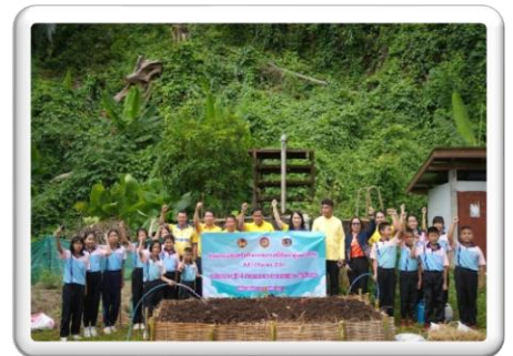
สร้างความยั่งยืน