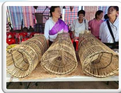
สร้างความมั่งคั่ง