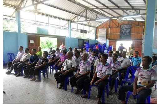
สกร.ระดับอำเภอท่าวังผา อบรมให้ความรู้ “การป้องกันโรคไข้เลือดออก”